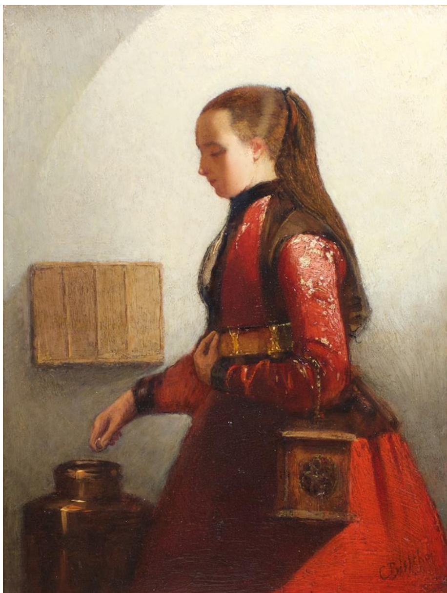
Hindelooper meisje van Christoffel Bisschop ca. 1800