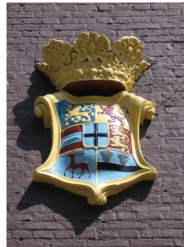
Het Nassauwapen van de Friese stadhouders Willem Frederik en Hendrik Casimir II op de zuidgevel van het museum.